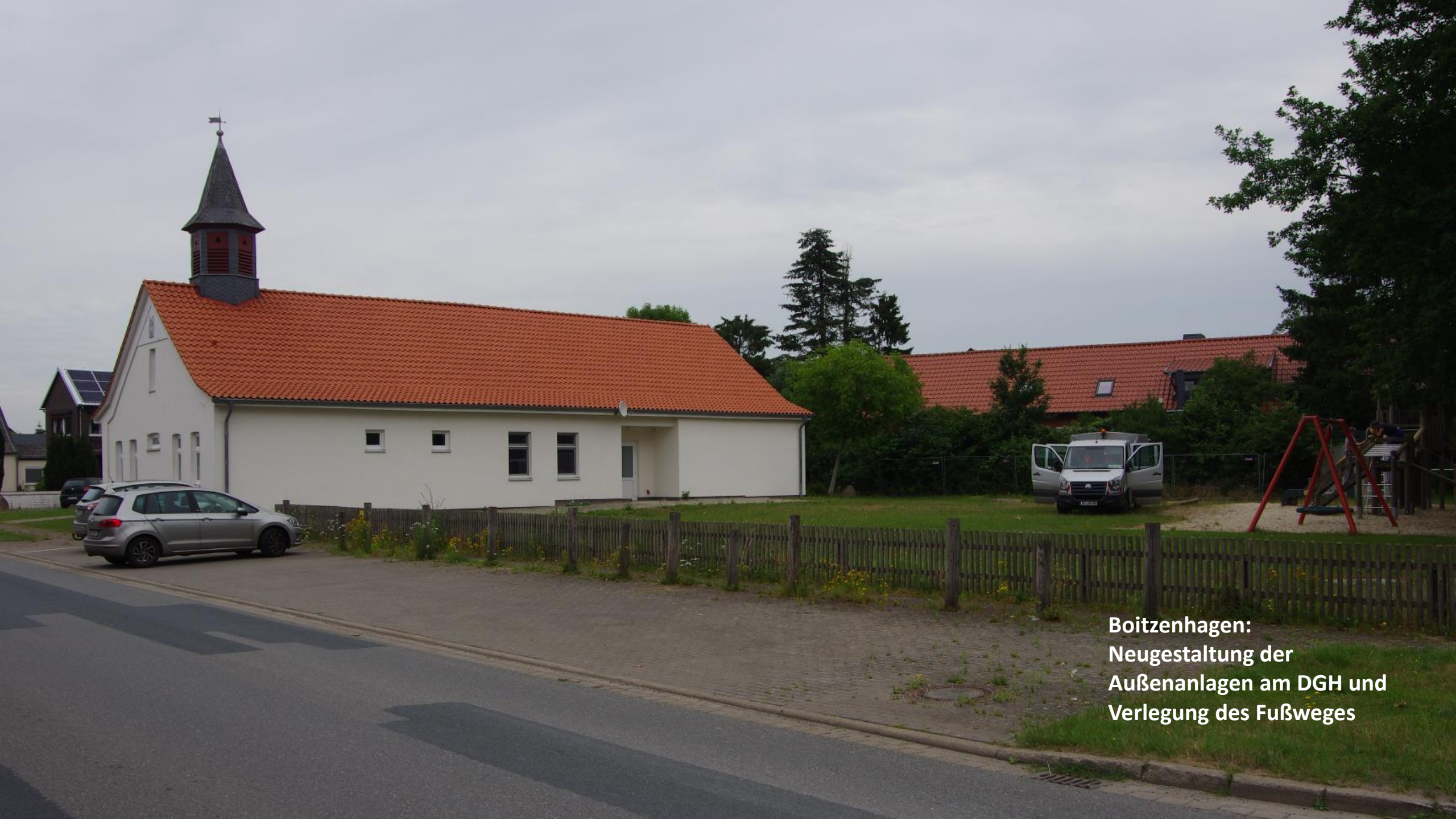
Boitzenhagen: Neugestaltung der Außenanlagen am DGH und Verlegung des Fußweges