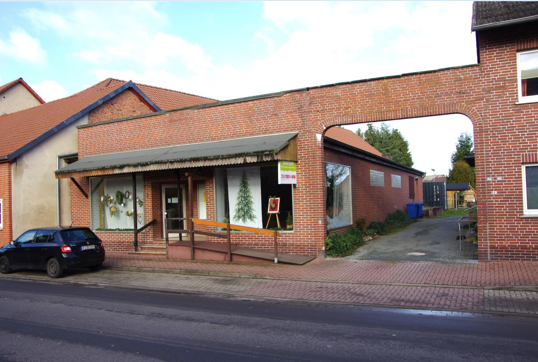
Ehra: Standort des Fördervereins MOSAIK