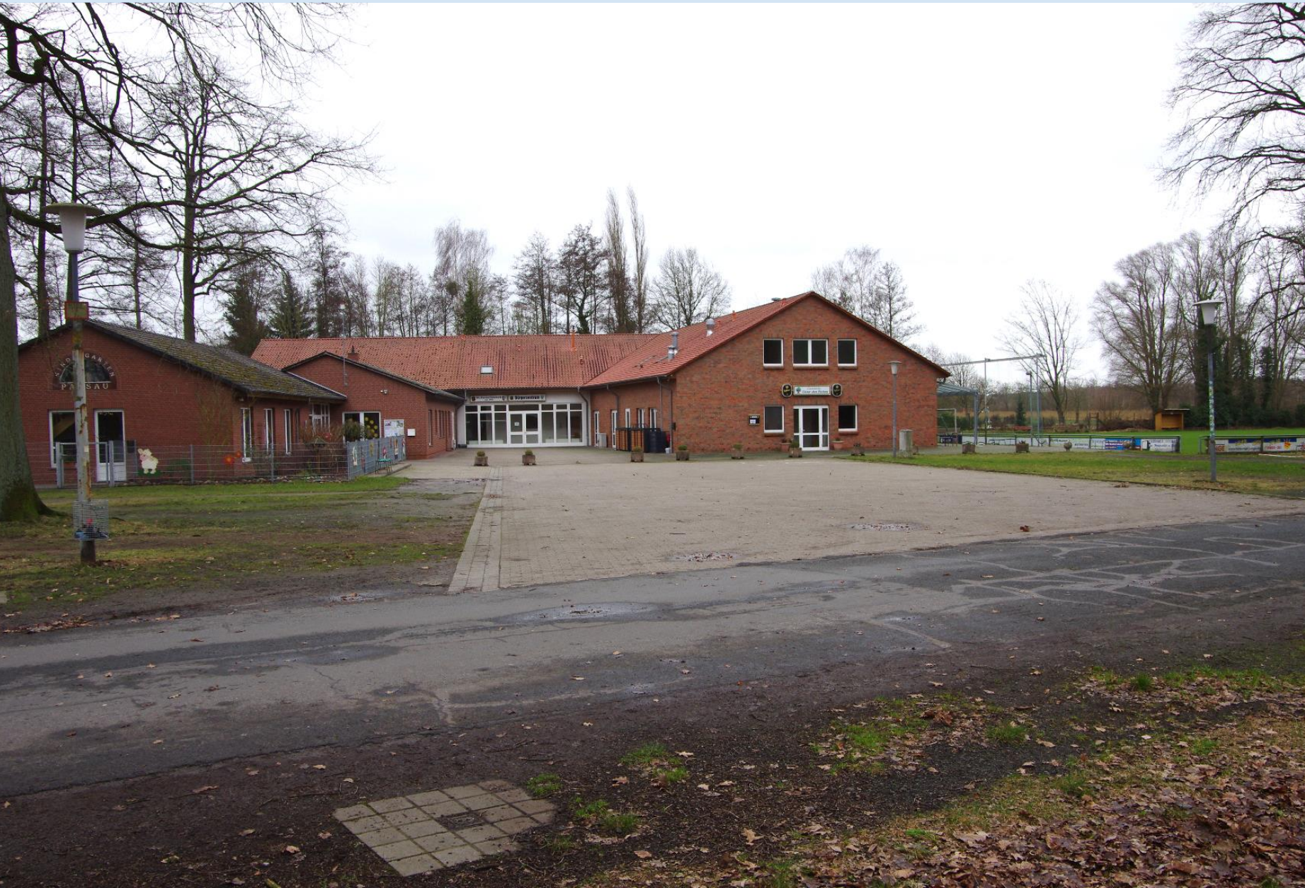
Parsau: Neugestaltung der Außenanlagen am Bürgerzentrum