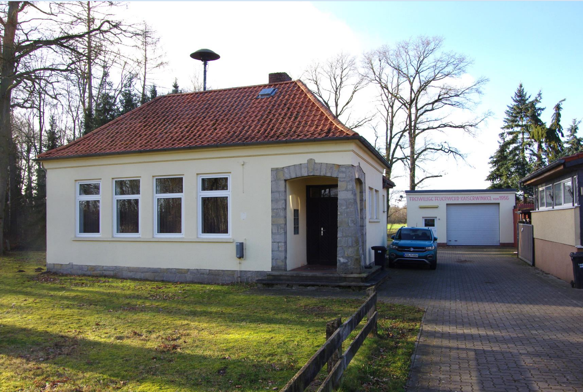
Kaiserwinkel: Sanierung des DGH einschl. Gestaltung der Außenanlage