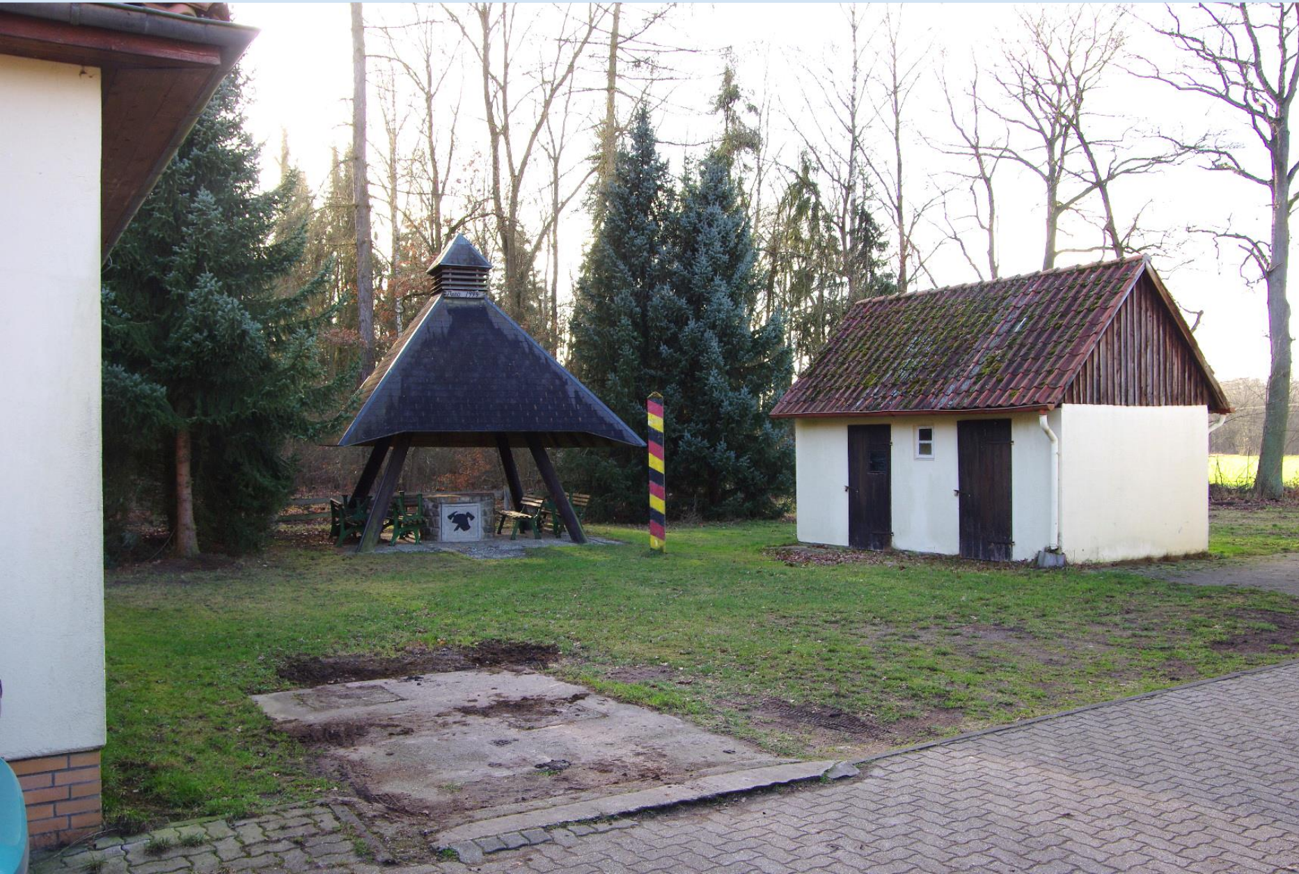
Kaiserwinkel: Erneuerung des DGH mit Gestaltung der Außenanlage