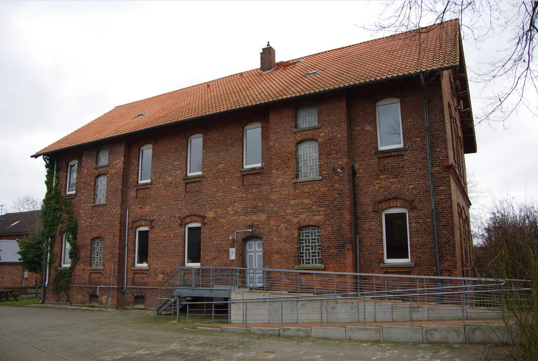
Parsau: Revitalisierung im Innenbereich