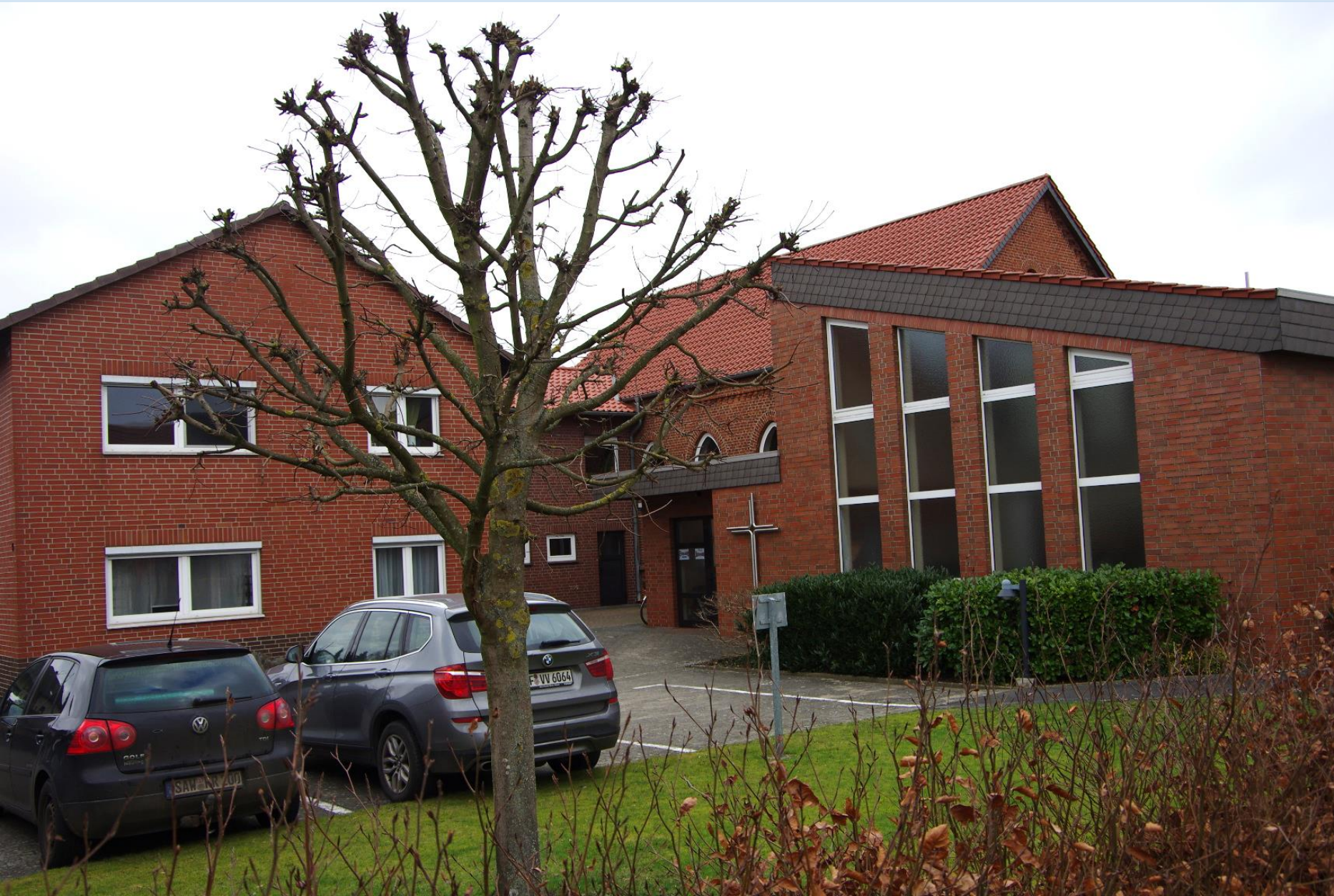
Parsau: Aufwertung der Außenanlagen an der Kreuzkirche